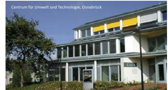
Centrum für Umwelt und Technologie, Osnabrück